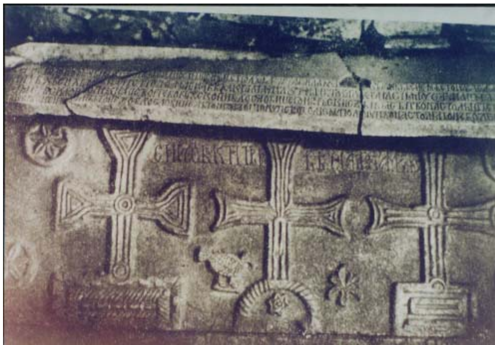
(Крстот и Сонцето македонски симболи на саркофагот на полошкиот епископ Јоаникие во црквата Св. Атанасие од 14 век )

употребувало и осмокракото сонце. Така, претседателот Глигиров повикал многу луѓе, меѓу кои и новинарот Спасе Шуплиновски. Тој ме извести дека во времето кога требело да се смени знамето, од претседателот Киро Глигоров добиле задача да одат низ Македонија и да испитаат во кои места и објекти е вградено осмокракото сонце. Така, биле испратени лица на осум места во Македонија и ги скенирале и испитувале симболите, а посебно на Сонцето како симбол и тоа шеснаесеткрако, дванаесеткрако, осмокрако и шестокрако.