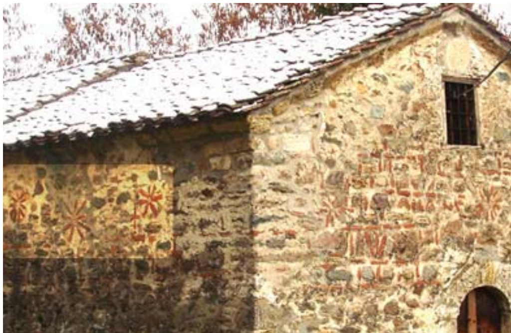
( Сонцето-македонскиот симбол, многу пати е созидаано на ѕидовите на црквата Св. Богородица во Лешок ) ( The sun-macedonian symbol,many times is built on the walls of the scurch the Virgin Mary in Lesok )

Значи, симбол сонцето било на трите цркви во Лешок, но, има и на надгробните споменици, а има крст и сонце во двете варијанти и во старите црковни книги и документи, како во Утешение грешним од Кирил Пејчинович и др.