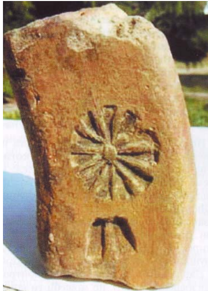
( Сонцето-македонскиот симбол низ вековите, локалитет Градиште Стенче-Извор: ред. бр.56 ) ( The Sun –macedonian symbol through the centuries, Gradiste Stence-Reservoir:ordinal number 56)

и искршени прозорите со дванаесеткрако сонце и расфрлени на земјата во кругот на манастирот.