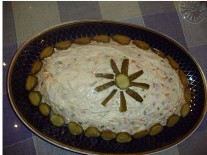
(Сонцето, вековен симбол на Македонците украсено со парчиња краставички на руска салата од мојата сопруга ) (The sun , for ages symbol of Macedonian people ,parts of gherkin on the russian salad by my wife )

Во 2005 година со реновирањето и реконструкцијата на црквата Св. Атанасие во Лешок, излеани се прозори-светларници со дванаестокрако сонце на двете куполи.