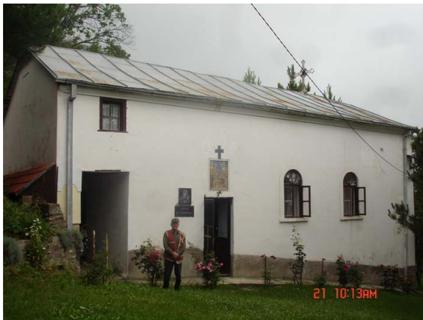
(црквата Св. Богородица, градена 1910 г. во Брезно) (church the Virgin Mary, build 1910 on Brezno)

Интересно е дека дванаесетокрако сонце е исклесано и во другите места на Полог, како што е примерот на стр.110-116 од книгата Брезно од Јован Савевски ( извор: ред.бр. 24), потоа, во с. Стенче (стр. 73) од книгата Тетовски древности, Полог од праисторијата до 7 век н.е. со посебен осврт на тетовскиот крај од Авторот Дарко Гавровски (извор: ред. бр. 157).