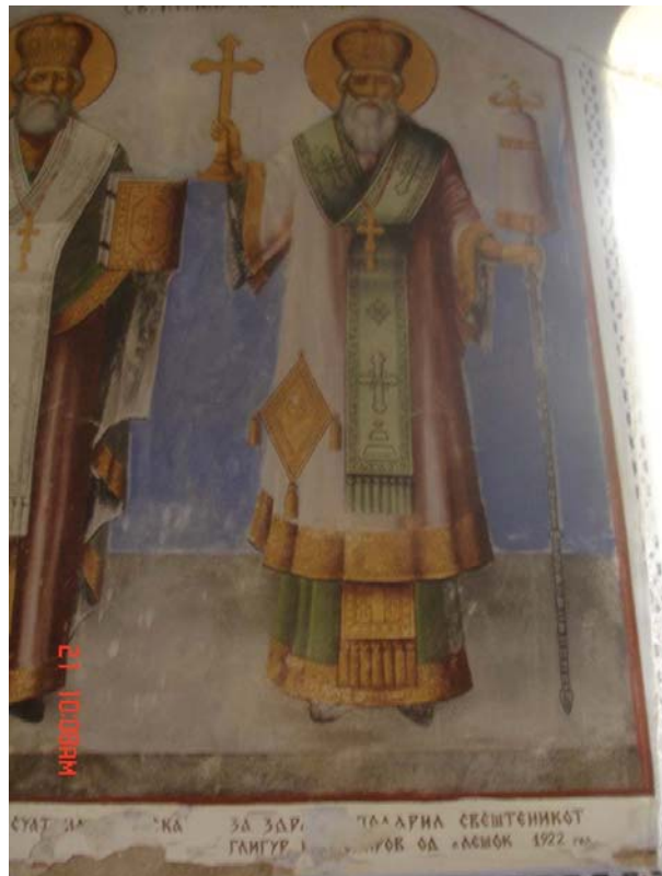
(фото:Митко Спирски, црква Св. Богородица. Брезно, поп Ѓиго Онуфриевски-дарител на фреска) ( foto: Mitko Spiroski, , the church Virgin Mary, 1910 Brezno, priest Gigo Onufrievski )