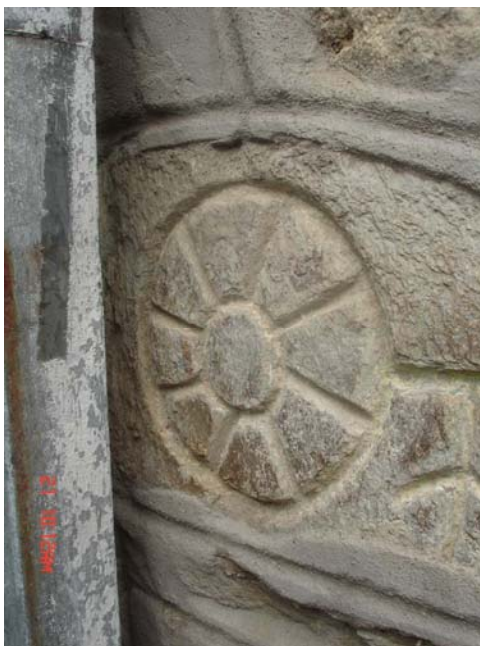
( Сонцето осмокрако, исклесано на ѕидовите од црквата Св. Богородица, градена 1910 г. во Брезно) ( The Sun with eight tentacles on the walls of the church the Virgin Mary,built in 1910-Brezno)