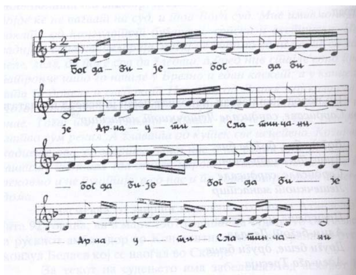
(Нотен запис на виолински клуч на песната Сардисале Лешочкиот манастир) (Music of a violin's key of the song Surrounding Lesok Monastery)

Во продолжување даваме и нотен запис на песната Сардисале Лешечкиот манастир, да може музичарите да ја имаат во изворна верзија.