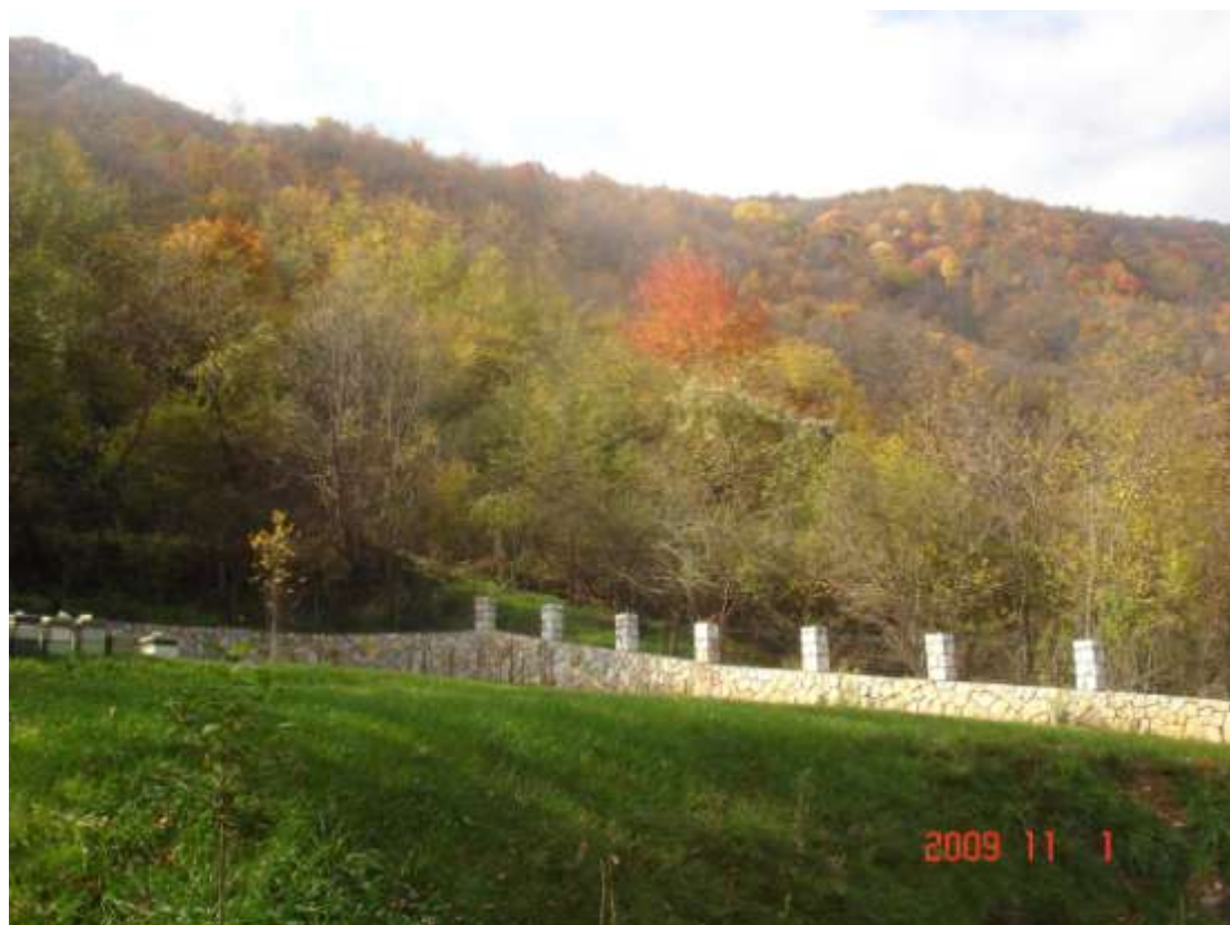
( Лешок, Кале, 01.11.2009, Златна есен) ( Kale 01.11.2009, Gold autumn)