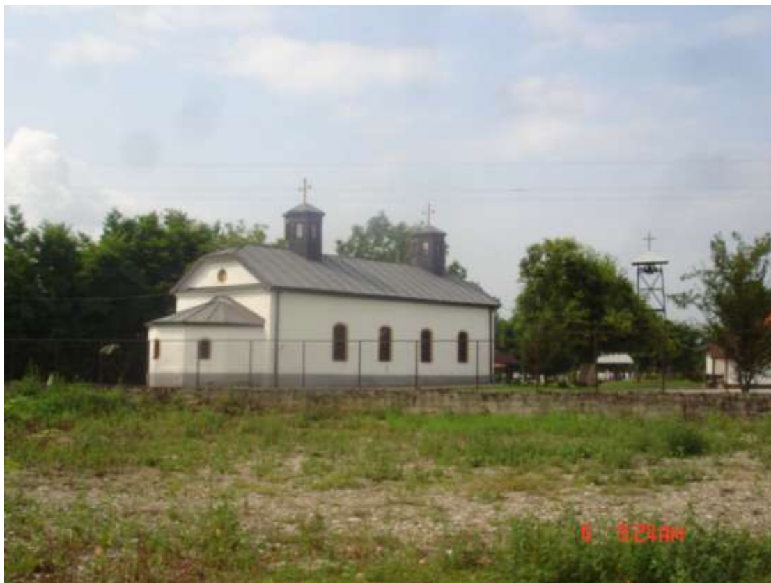
( Фото:Митко Спирски, Јули 2009, Црквата Св. Никола од Жилче) ( Photo:Mitko Spiroski, July, 2009, the church St. Nikola - Zilce)