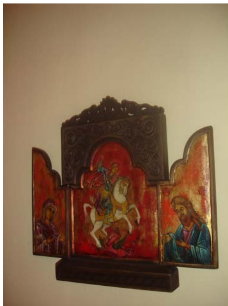
( Домашна икона: Св. Великомаченик Димитриј, Митровден, мој Именден кој го славам ) ( Domestic icon : St. Velikomacenic Dimitrij, Mitrovden, my Nameday, I celebrate it )

Инаку, кога почнав да работам со колегите го обележував Митровден-мојот Именден, а од кога се оженив 1981 година во семејството секоја година го славам Митровден.