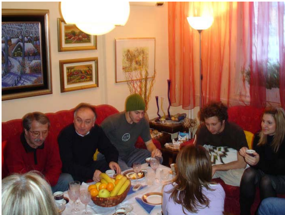
(Од славењето на Пречиста, моја домашна слава, 4 декември 2006 год. ) (Celebratin of Refinement-Precista, my family feast , 4 December,2006 )