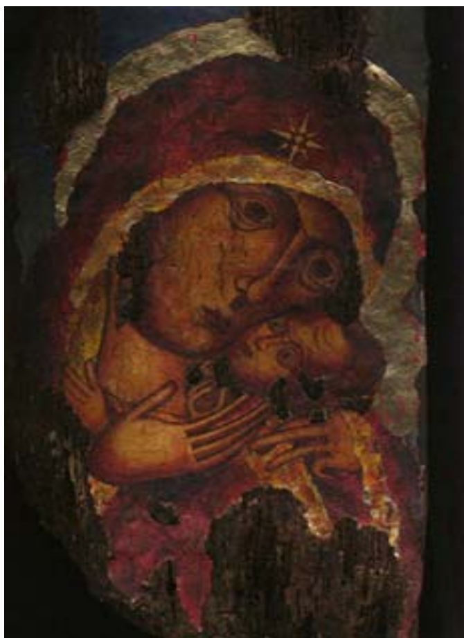
(Семејна икона: Пресвета мајка Богородица, домашна слава родот Лалошой и фамилија Спирски) (Family icon : the Virgin Mary, family feast of the kin Lalosoi and family Spiroski)

Славата се пренесувала од колено на колено и тоа само по машки род.