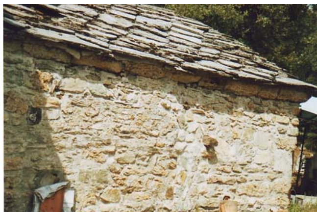
( Црквата Св. Архангел Михаел во Непроштено) ( The church Michaelmas Day in Neproshteno)