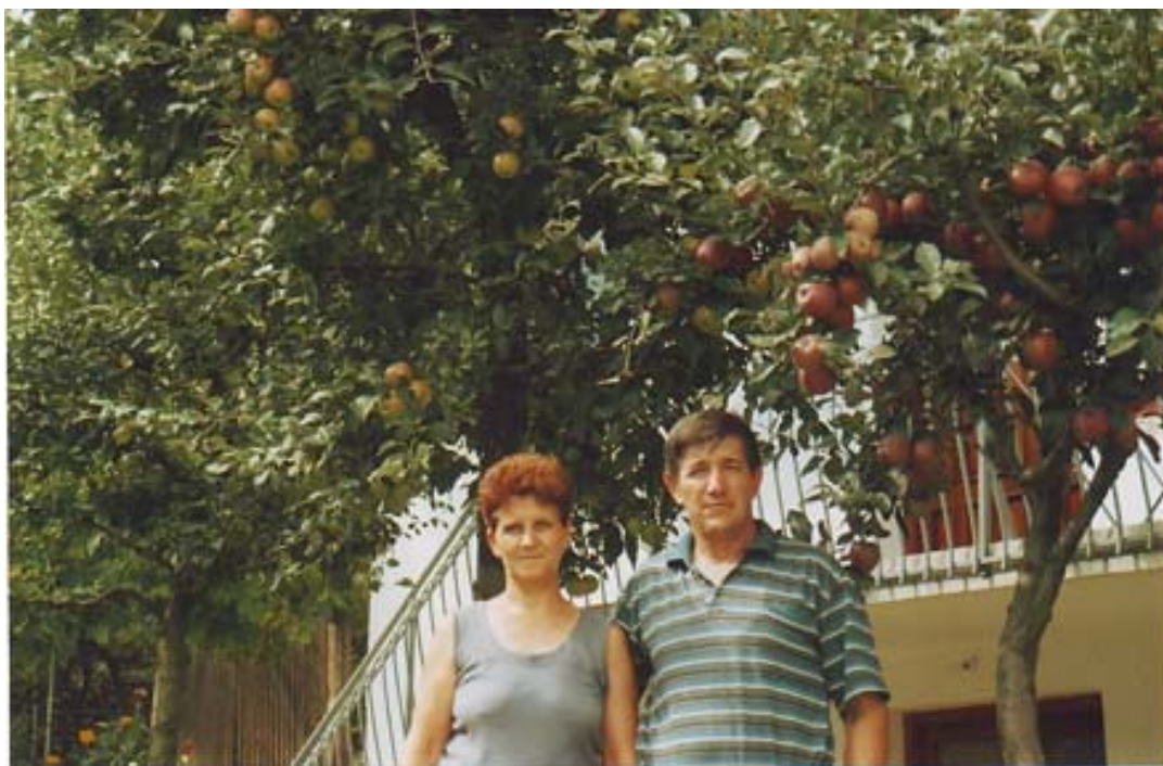
(Непроштено, 2003, Пред куќата и Тетовските јаболки од вредните раце на Непроштенци) (Neproshteno, 2003, In front of the house and Tetovo's apples of the people from Neproshteno)

Лозата на Лалошой од Непроштено има вкупно 374 лица, додека од родот на Лалошой од Лешок има 1254 лица од вкупно 1645 лица на целиот род Лалошой.