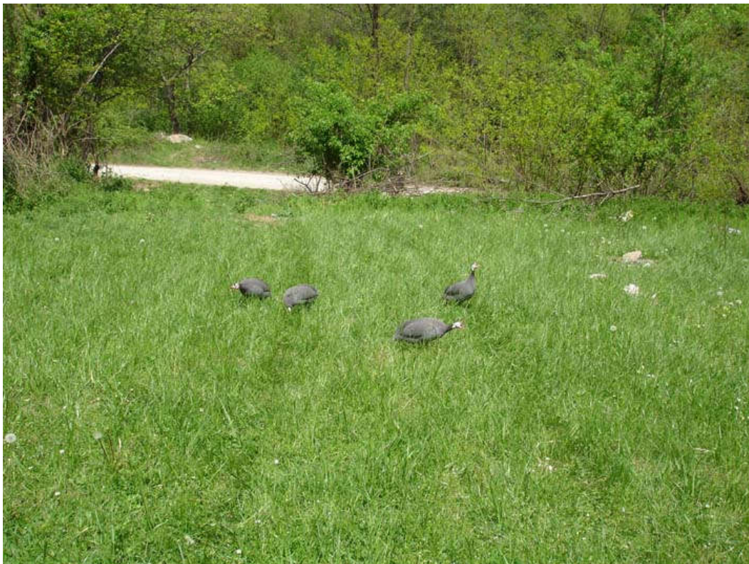
(Зелени ливади во Лешок) (Green fields in Lesok)