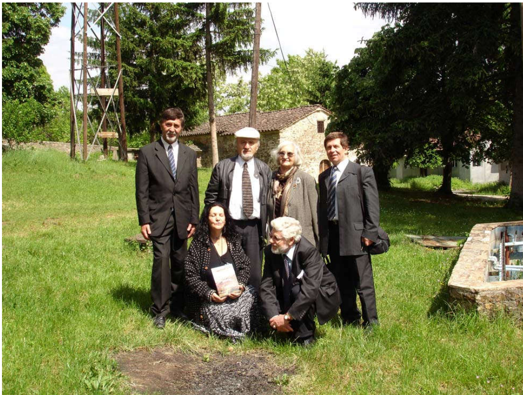
(Писатели и поети гости на Манифестацијата 160 години Кирил Пејчинович во Лешок) (Writers and poets of the Manifestation 160 years of Kiril Peychinovich in Lesok)