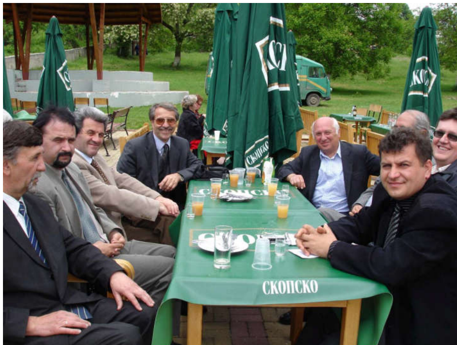
(Учесници на Манифестацијата 160 години Кирил Пејчиновиќ во Лешок) (Celebration on Manifestation 160 years Kiril Pecinovic, Lesok)