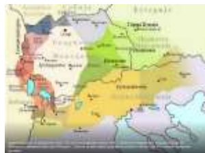
Карта на говорите - дијалектите на македонскиот јазек, фото, преземено

језик - јазик, мускулест орган во уста на луѓето и животните, кој помага при јадење и при испуштање на гласови ( гласоој ) од устата. Кај луѓето јазикот служи за зборување и за општење меѓусебно и за изразување на мисли, чувства и др. Јазикот помага да зборуваме ( зборимо ), да ошштите и комуницираме меѓу себе преку говорот. Во Лешок ние зборувавме на Љешечки гоор. Подолу давам неколку мисли кој ги збрефмо на јазикот у Љешек. ( језикот му е побрс от умот; уста има језик нема; он нема влакна на језик; он је пис на језик; млого испи ракиа, му се врза језикот ), в. Љешечки гоор,