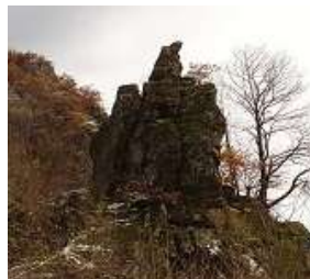
Јасребоа карпа покрај Лешочка река.

Јасребоа карпа - интересна карпа лево од Лешочка река кај местото Бавче.