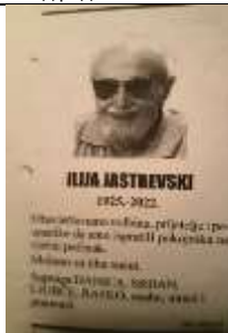
Риека, Јули, 2022-Некролог-жална вест