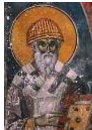
Св. Спиридон Чудотворец, фото, преземено

Спиро - машко име, добиено по светецот Св. Спиридон, на кого моштите му се на островот Крф, Грција на Јонско море. Името симболизира богатство и моќ. Во 1999 г. со семејството бевме на Крф и се поклонив на моштите на светецот Спиридон. Славата Св. Спиридон се слави на 25 декември секоја година, а овој светец е заштитник на повеќе занаети (калајзии, кондуразии, самарзии и др.). Во Старо село, Долни Полог, општина Јегуновце, има црква Св. Спиридон, која е заштитник на селото.